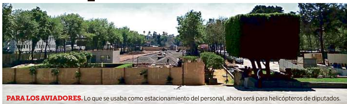
PARA LOS AVIADORES. Lo que se usaba como estacionamiento del personal, ahora será para helicópteros de diputados.

Además erogan 30 millones de pesos en puertas y accesos a San Lázaro