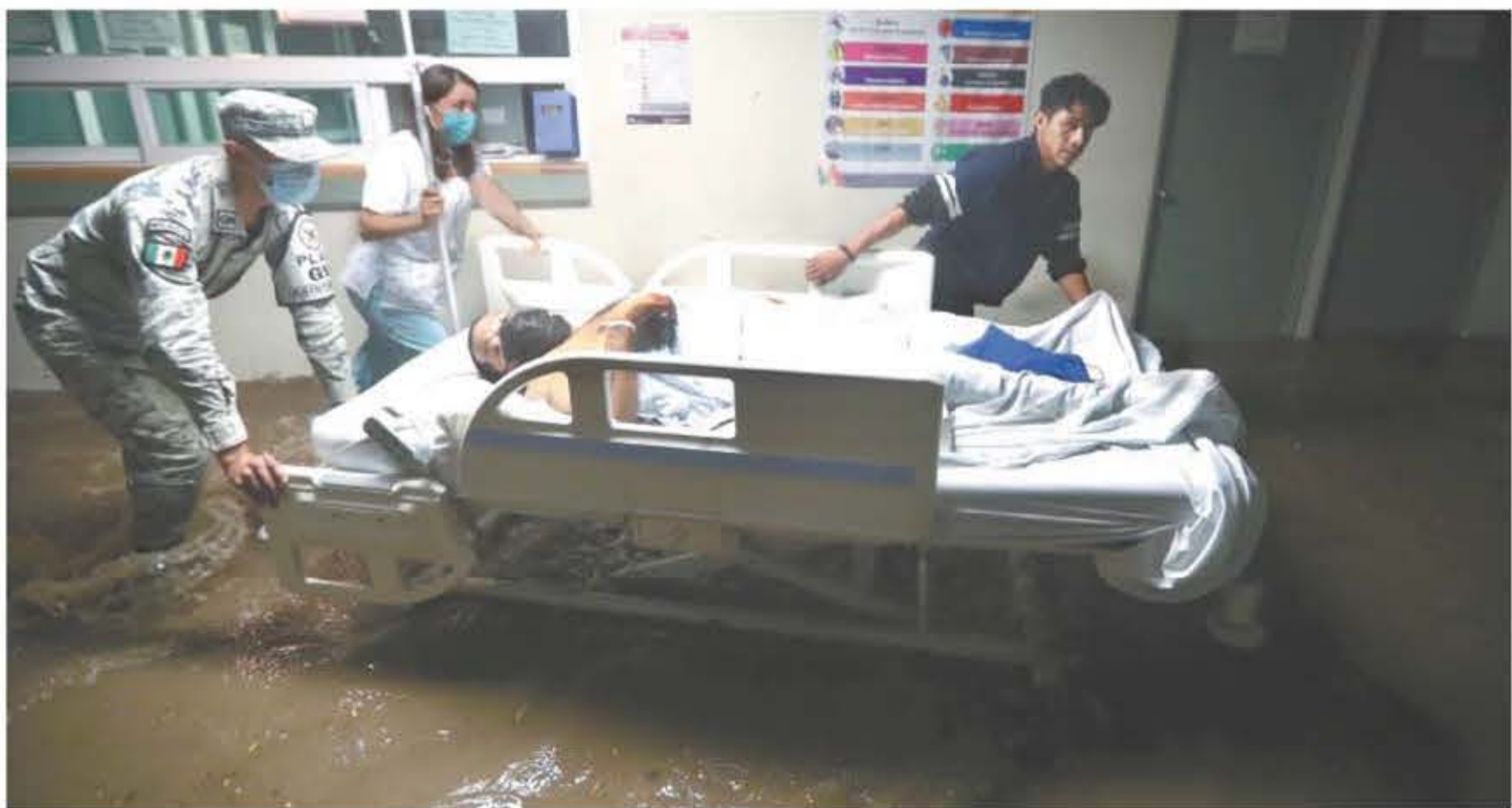
VALENTE ROSAS/EL UNIVERSAL

Atizapán de Zaragoza. — Una tormenta con granizo dejó decenas de vehículos bajo el agua e inundó más de un centenar de casas en el Estado de México. Atizapán fue uno de los municipios más afectados, donde pacientes internados en el Hospital General tuvieron que ser reubicados en otras unidades médicas. | A18 |