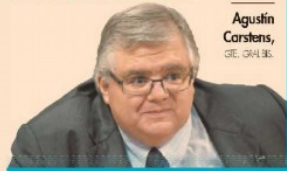
Agustín Carstens, CEO BIS

No todo es monetario o fiscal. Debemos encontrar cómo incentivar la inversión y estimular la competencia económica para tener crecimiento sostenible (...) el reto es aprender a convivir con el virus".