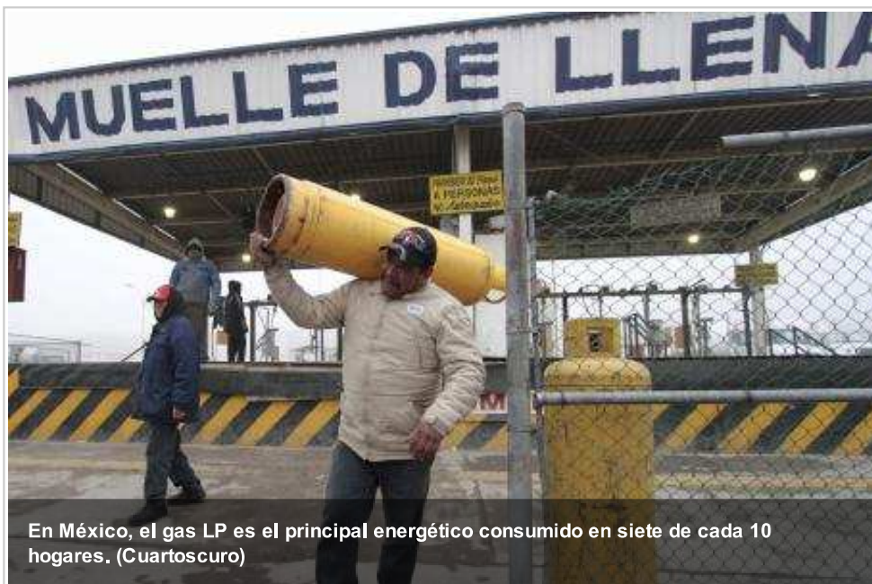
En México, el gas LP es el principal energético consumido en siete de cada 10 hogares.

Mientras el precio de todos los combustibles bajó, en el caso del gas LP , el consumidor registró un incremento de casi tres por ciento en promedio en el primer mes de este año, frente a lo que se cobró en diciembre de 2015.