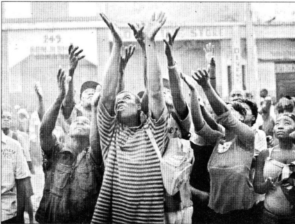
Damnificados haitianos luchan por mercancías lanzadas desde una tienda destruida en Puerto Príncipe. Los sobrevivientes del sismo esperan desesperadamente ayuda humanitaria