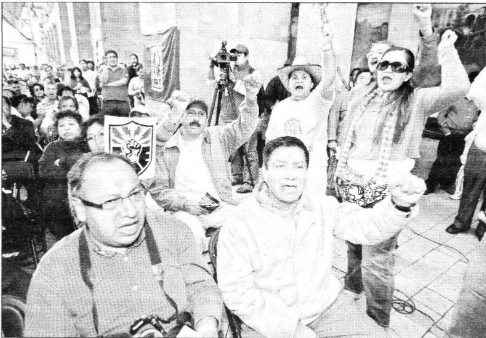
Miembros del Sindicato Mexicano de Electricistas, durante el mitin para denunciar abusos laborales de la Comisión Federal de Electricidad (CFE) contra personal que le trabaja en el Distrito Federal y otros estados, e instar a los consumidores a no pagar la luz a esa empresa, en el mitin de este domingo en la explanada de la delegación Tlalpan

Fax: 5605-2099 • juliohdz@jornada.com.mx