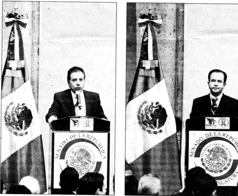
Jesús Ortega, líder del PRD, y César Nava, dirigente del PAN, participaron en los trabajos organizados por el Senado para discutir la reforma política

Fax: 5605-2099 • juliohdz@jornada.com.mx