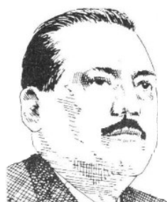
Manlio F. Beltrones.

Ya le había comentado que mucho del alza en los precios de las materias primas, encabezadas por el petróleo, se debe a una mejoría en la demanda tanto en Estados Unidos como en Europa, sin dejar pasar que ha seguido fuerte la demanda por esos bienes en naciones como China y la India.