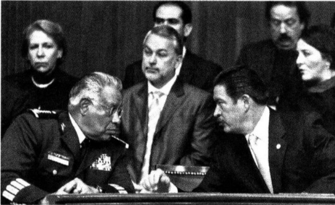
> El Secretario de la Defensa, Guillermo Galván, y el presidente del Senado, Carlos Navarrete.