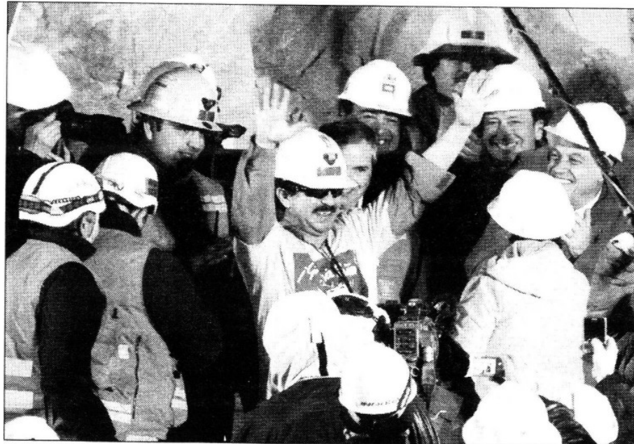
El rescate de los mineros en Chile fue uno de los fenómenos positivos ocurridos durante 2010

Pero empieza el año nuevo y ya se hizo viejo el cambio que no quiso ser de régimen.