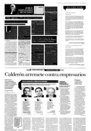
Calderón arremete contra empresarios