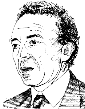
Guillermo Ortiz Martínez.