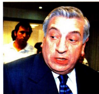
Arturo Núñez. Promueve sesiones secretas.

¿En lo oscuro? El tabasqueño Arturo Núñez Jiménez, senador cercano al grupo de su paisano Andrés Manuel López Obrador, promueve una iniciativa para que el Senado de la República pueda llevar a cabo sesiones secretas cuando se traten "asuntos considerados como reservados en términos de ley". Hasta ahora, el reglamento senatorial sólo marca la celebración de sesiones ordinarias, extraordinarias y públicas, pero nada de secretas. Contraria al espíritu de transparentar la acción de los servidores públicos que desde hace varios años se habla en el país, la propuesta de Núñez Jiménez establece que las sesiones secretas, dada la naturaleza del asunto que tratan, se realizan "sin la presencia de público y de los representantes de los medios de comunicación social y no se transmiten en vivo por el Canal del Congreso o por internet".