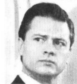
ENRIQUE PEÑA NIETO

Se derrumbaron también los ingresos fiscales. La caída del ISR ha sido hasta de 32.7%, lo cual sería normal en una recesión en la que cae la producción. Pero también la recaudación del IVA baja hasta en 30% según estimaciones no oficiales, lo que significa que la recesión también pega cada vez más fuerte en el consumo.