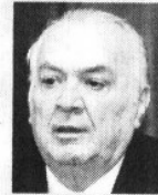
MIGUEL DE LA MADRID

no lo harán en cualquier iglesia que aparezca como simple escenario, sino que se irán a casar a la catedral de Toluca, la misma donde el gobernador Enrique Peña Nieto suele aparecer en todos sus actos personales religiosos. Todo con cargo al erario y en una de esas hasta aparecen invitados al gran final el gobernador y su carismática gaviota... Tres días después de que tuvo que autodeclararse “inhabilitado mental”, Miguel de la Madrid fue recibido en Los Pinos. En una comida privada con el presidente Calderón, al ex mandatario que unas horas antes había dicho que ya no procesaba se le vio tranquilo y conversador, mientras que el actual hizo gala de cortesía política... Empezó la cuenta regresiva de los 30 días antes de las elecciones del 5 de julio y con ello los operadores de Los Pinos tendrían que empezar a reconstruir los puentes de diálogo y negociación que fueron dinamitados por los misiles de la campaña de Germán Martínez. Si no lo hacen, el 6 de julio puede comenzar una pesadilla para el gobierno, que se enfrentaría a una Cámara de Diputados sembrada de minas y resentimientos de campaña... Los dados no dudan. Escalera. Buena semana.