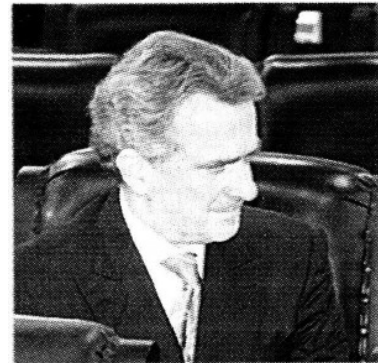
Santiago Creel.