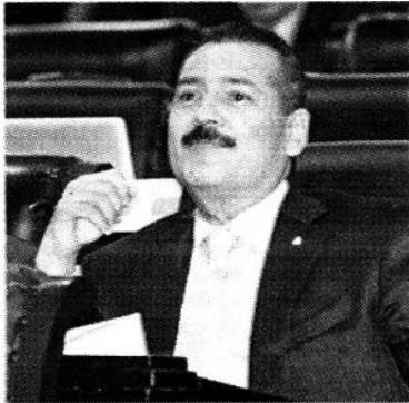
Manlio Fabio Beltrones.