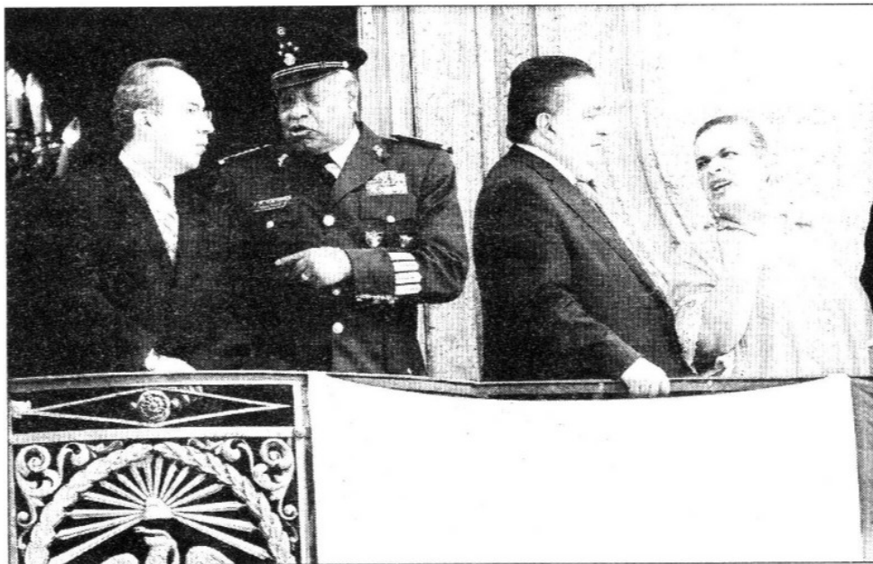
Acompañado por los secretarios de la Defensa, Guillermo Galván, y de Gobernación, Fernando Gómez Mont, así como por la dirigente nacional del PRI, Beatriz Paredes Rangel, el presidente Felipe Calderón encabezó en Morelia el desfile conmemorativo del 244 aniversario del natalicio de José María Morelos y Pavón

Fax: 5605-2099 • juliohdz@jornada.com.mx