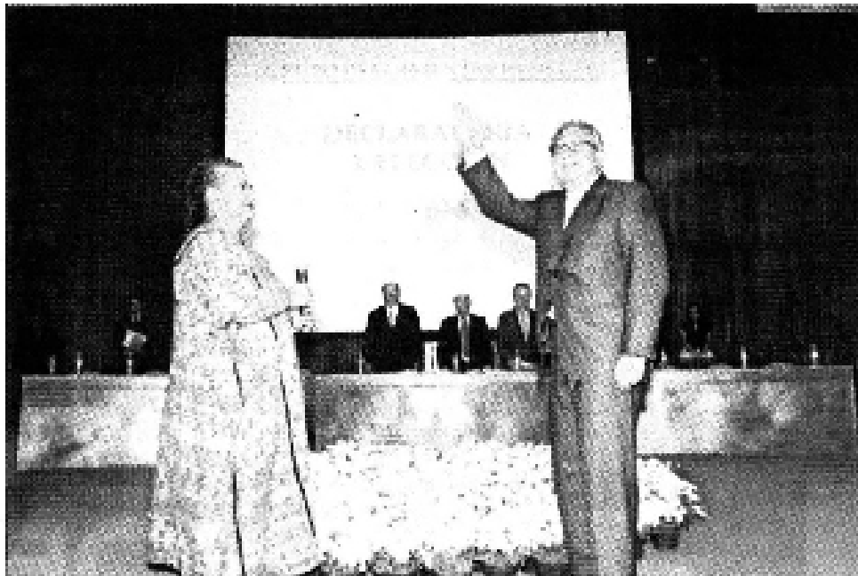
La presidenta del CEN del PR, Beatriz Paredes, en un acto realizado en el auditorio Putzaco Elias Calles, formó protesta como coordinador parlamentario el diputado Francisco Rojas, quien manifestó su decisión de fortalecer la unidad del partido y se comprometió con los legisladores orizatas a enfrentar la crisis que atraviesa el país

Fax: 5615-2099 • julio10dz@jornada.com.mx