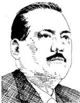
Manlio Fabio Beltrones.

Algo positivo de la crisis económica global es que podría servir para que México destrabe las reformas estructurales pendientes.