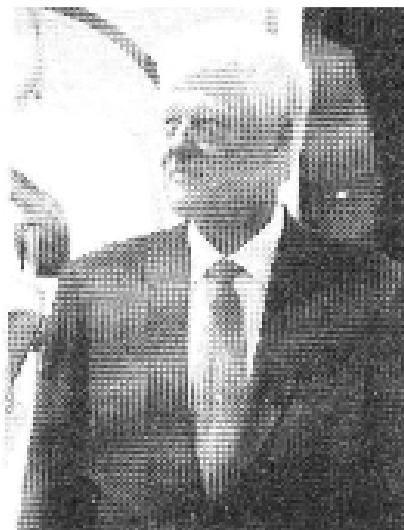
Bill Clinton.