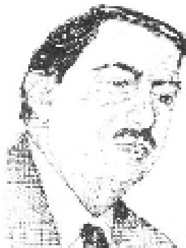
Napoleón Gómez Urrutia.