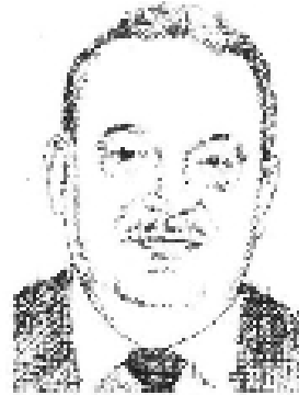
Carlos Slim Helú.

Como sabe, en la búsqueda por elevar los ahorros en las empresas en los últimos años ha crecido el fenómeno de la tercerización conocida como el outsourcing .