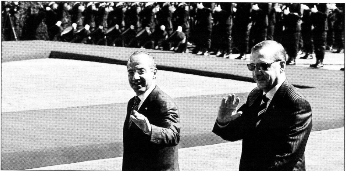
El presidente Felipe Calderón al recibir ayer en Los Pinos al primer ministro de Turquía, Recep Tayyip Erdoğan

Fax: 5605-2099 • juliohdz@jornada.com.mx