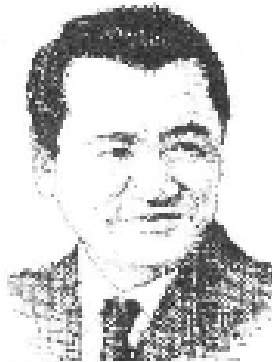
M. Angel Osorio Chong.