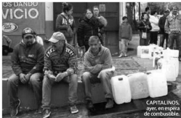
CAPITALINOS, ayer, en espera de combustible.

EN SANTA ANA Ahuehuepan retienen 4 horas a soldados que realizaban operativo antihuachicol págs. 3 y 4