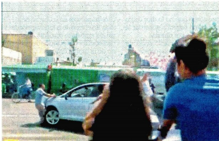
Un video que se viralizó en redes sociales muestra el momento justo en que un conductor atropella a vecinos que bloqueaban la calzada Ermita.

Precisó que está en marcha el programa emergente de abastecimiento de carros tanque (pipas) para Iztapalapa y vehículos del Sistema de Aguas de la Ciudad de México. En apoyo a las medidas adoptadas se puso a disposición de los usuarios los números telefónicos del Sacmex 56-54-32-10 y 57-09-92-93, con 10 líneas, y los números telefónicos de la delegación Iztapalapa. ●