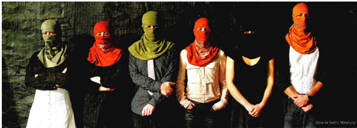
Obra de teatro Mateluna 2