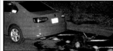
Dos hombres murieron al ser baleados en Paso de la Reforma. Los atacantes huyeron, pese al CS. Ver página 6