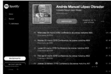
Las conferencias de Andrés Manuel López Obrador a cualquier hora.