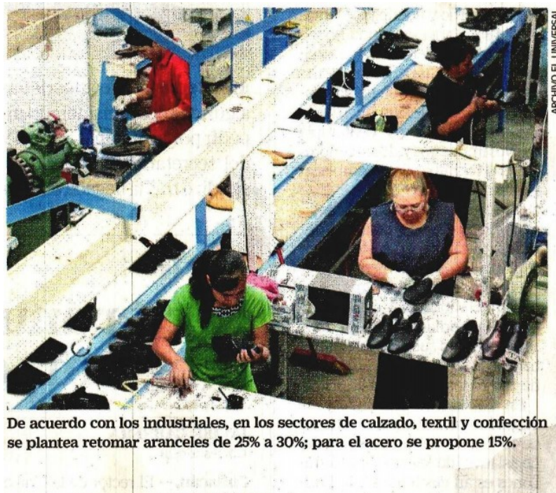
De acuerdo con los industriales, en los sectores de calzado, textil y confección se plantea retomar aranceles de 25% a 30%; para el acero se propone 15%.