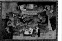
Suave patria, de Manuel Felguérez.