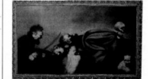
Violencia e intolerancia, de Rafael Coronel.