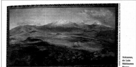
Volcanes, de Luis Nishizawa Flores.

El crecimiento de la burocracia y de la alta burocracia en el régimen de cuates le ha costado muy caro a los mexicanos, señaló. Además, reveló que en el primer trimestre del año presentarían una propuesta de simplificación administrativa, racionalidad y una optimización de los recursos humanos, cuidando a los trabajadores administrativos. NACIÓN A8