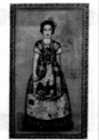
China Poblana, de Julio Galán.