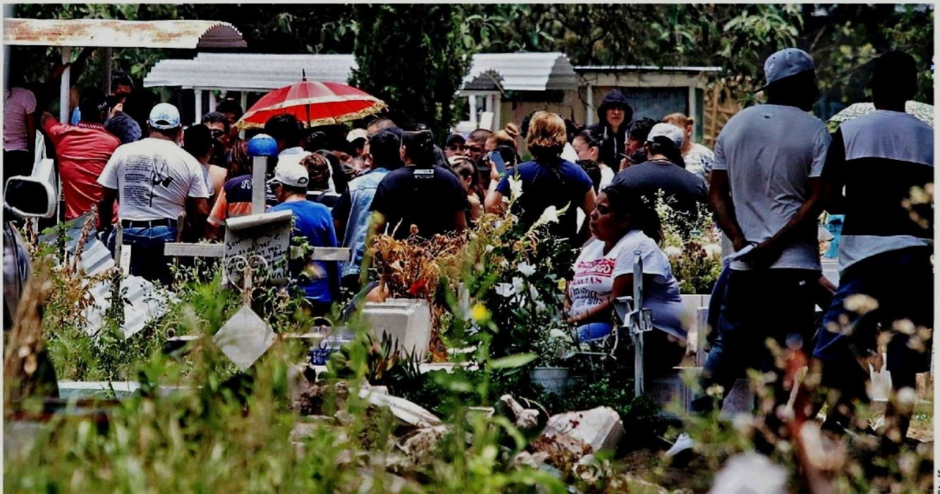
EL ADIÓS. Unas 200 personas, entre familiares y amigos del integrante de la banda, acudieron al camposanto de San Isidro.

MAYO 5. Matan a “El Gaznate”, ex integrante de la Unión Tepito, en su automóvil BMW, que se encontraba en un estacionamiento de la calle Belisario Domínguez.