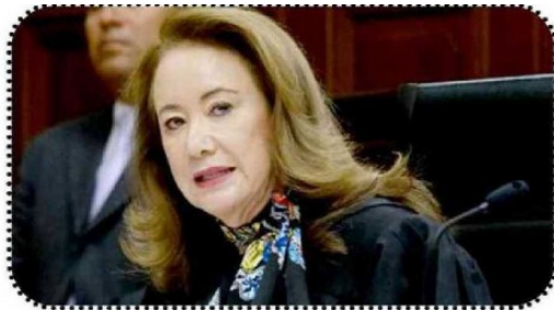
Yasmín Esquivel Mossa