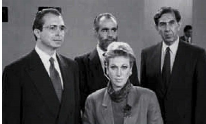
Año 1994, el inicio de la historia.