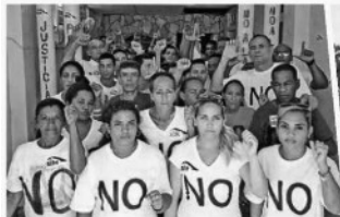
Disidentes, en huelga de hambre, ayer.