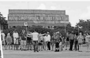
Castrismo acarrea a votantes por el sí.