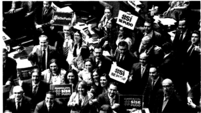
CELEBRAN. Con colores representativos de sus partidos, la oposición y Morena en el Senado festejaron ayer la aprobación para crear la Guardia Nacional; ahora falta que los diputados avalen los cambios.