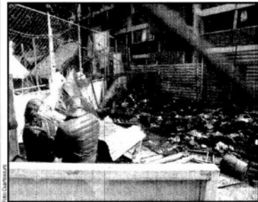
El campamento de los damnificados del multifamiliar de Tlalpan se incendió la madrugada del domingo. No hay heridos.