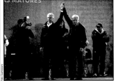
CHALCO, Méx. - Andrés Manuel López Obrador y Alfredo del Mazo Maza. Inicio del nuevo programa de ayuda a adultos mayores.