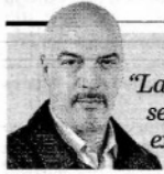
Carlos Puig "Las mañaneras de AMLO se han convertido en un extraño show" - P. 2