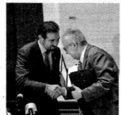
Pacto con el INE. J.C. BAUTISTA

La Bolsa registró ayer una pérdida de 0.52%, que significó su octava jornada consecutiva de caídas y su peor racha en tres años. PAG. 6 Y 23