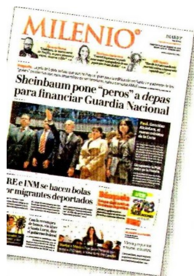
MILENIO consignó las reservas de la jefa de Gobierno.

Con información de: Selene Flores, Cinthya Stettin, Silvia Rodríguez y Elia Castillo