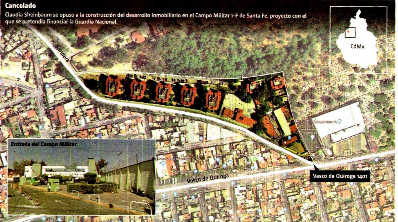
• FUENTE: MILENIO • INFORMACIÓN: Jannet López • GRÁFICO: Alfredo San Juan