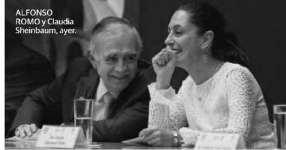
ALFONSO ROMO y Claudia Sheinbaum, ayer.

Alfonso Romo, jefe de la Oficina de la Presidencia, asegura que se trabaja para destrabar lo que impida llegar a ese objetivo; destaca esfuerzos por impulsar confianza para atraer inversión, apoyo al sur-sureste... pág. 19