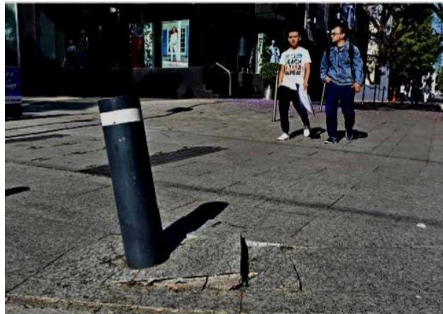
■ Con el paso de los días la infraestructura urbana sufre diversos daños, por lo que se le debe de dar mantenimiento.