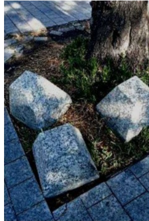
■ En las jardineras quedan los bolardos que se han desprendido.

tante es darle su mantenimiento adecuado, esto de Masaryk tiene ya mas de tres años y toda infraestructura se empieza a deteriorar”, expresó Rodríguez Lara.