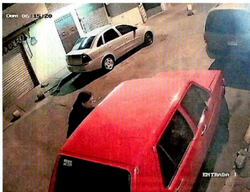
Un vecino compartió una imagen captada por las cámaras que instaló afuera de su casa, en la que se aprecia a un hombre que se robó los espejos de su auto.