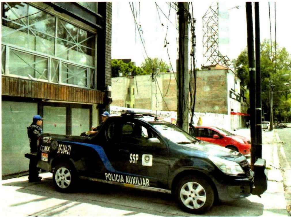
Una patrulla vigila que el terreno no sea invadido o mal utilizado/LAURA LOVERA