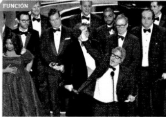
TRIUNFA. Green Book. Una amistad sin fronteras ganó como Mejor Película.