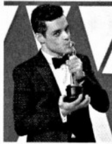
CONFIRMA. Rami Malek se llevó el Oscar como Mejor Actor.