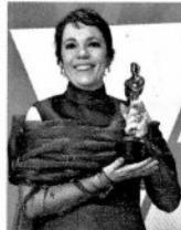
SORPRESA. Olivia Colman se impuso como Mejor Actriz.