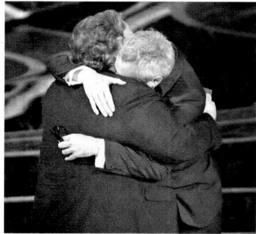
MÉXICO GANA CON CUARÓN. El director Guillermo del Toro, quien recibió una estatilla el año pasado, fue el encargado de entregar el Oscar como Mejor Director a su amigo Alfonso Cuarón.