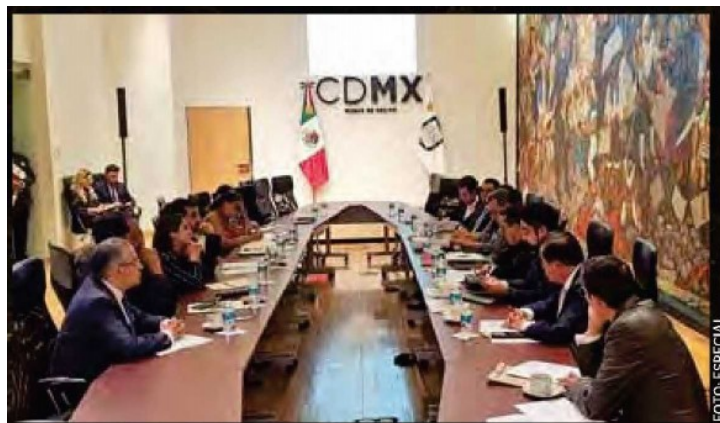
El equipo de transición de Claudia Sheinbaum se reunió ayer con funcionarios del gobierno central de la actual administración.