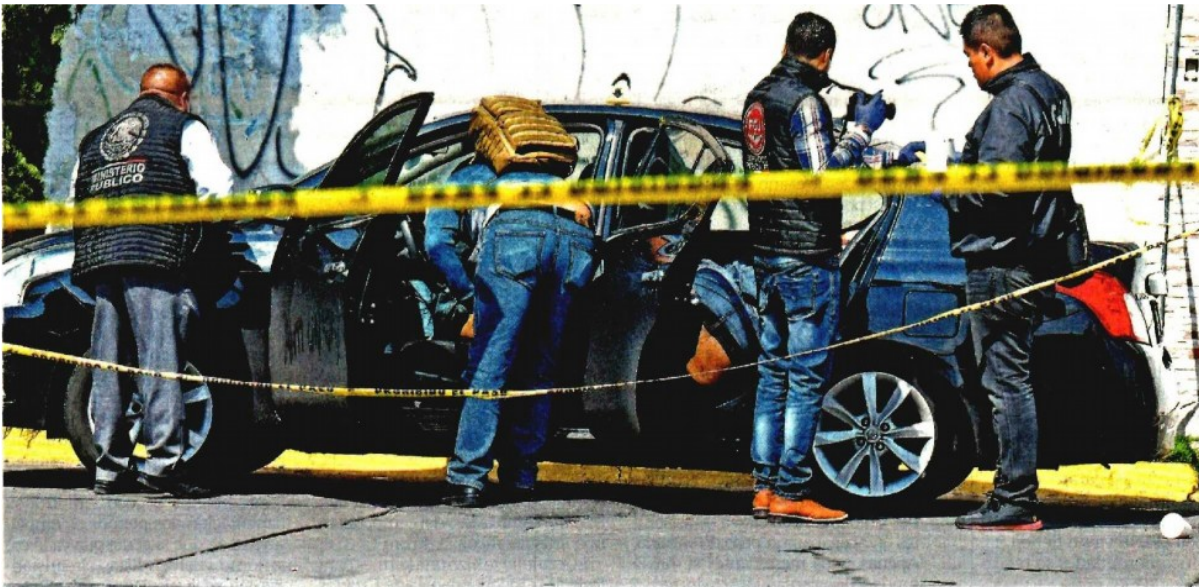
Personal del Ministerio Público y Servicios Periciales acordonaron la zona donde seis hombres asesinados fueron encontrados en un vehículo abandonado.

En la última semana se han registrado 12 asesinatos en los municipios de Nezahualcóyotl, Ecatepec y Naucalpan y en los cuerpos aparecieron cartulinas con la firma Anti-Unión .