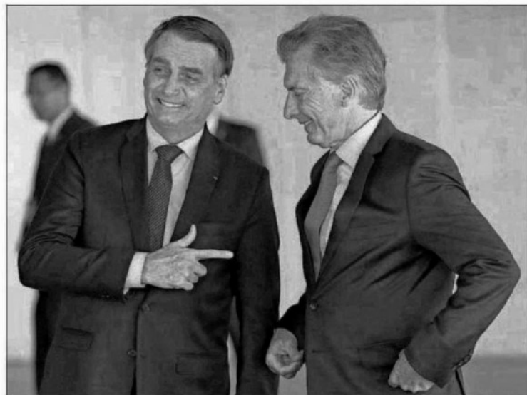
MACRI Y BOLSONARO, EN SINTONÍA FRENTE A MADURO. El presidente argentino, Mauricio Macri, visitó ayer a su homólogo brasileño, Jair Bolsonaro, en Brasilia. Ambos condenaron al régimen venezolano —el primero, con más contundencia— y se declararon partidarios de fortalecer Mercosur. PÁGINA 6

Honduras". A diferencia de la anterior caravana, esta vez encontrarán un nuevo Gobierno, el de Andrés Manuel López Obrador, que ha prometido empleos y servicios sociales a los centroamericanos que ingresen de forma ordenada y por los puntos oficiales de la frontera. PÁGINA 9