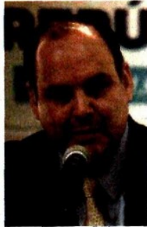
Gustavo de Hoyos