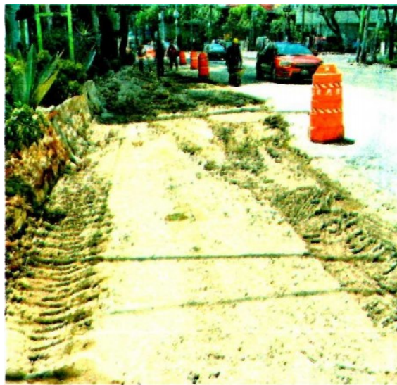
El reencarpamiento de vialidades afectadas es una de las obras que asume la AGU/DANIEL GALEANA