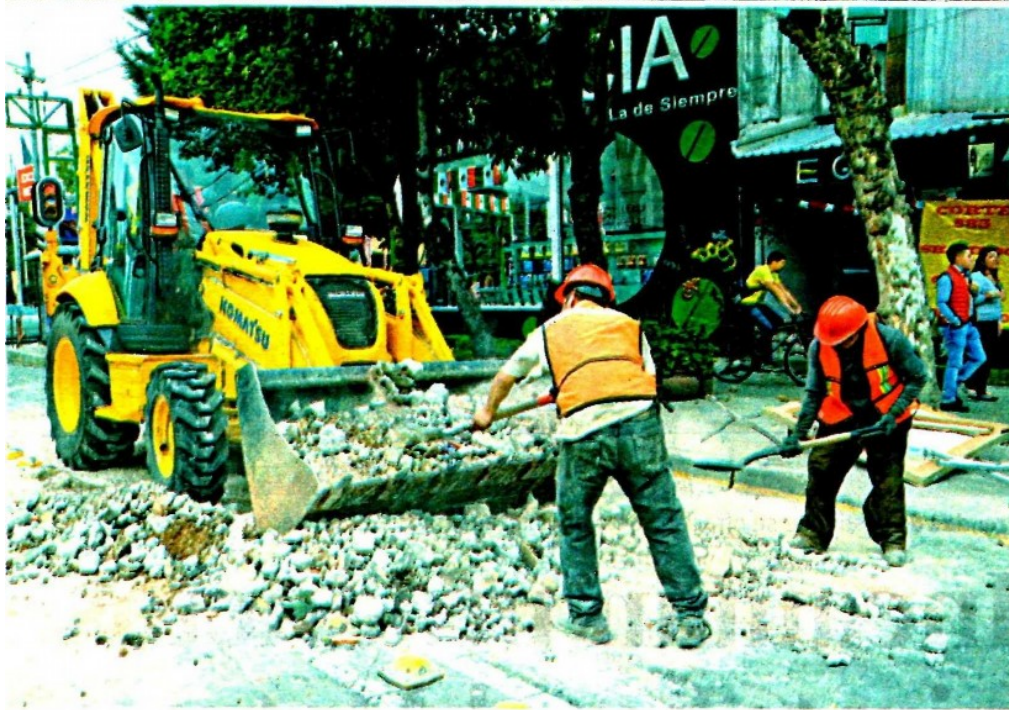
Es la delegación Iztapalapa de donde más escombro se ha retirado