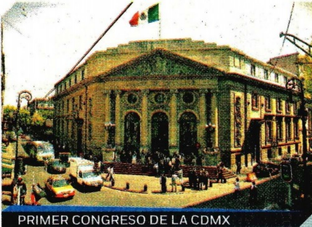
PRIMER CONGRESO DE LA CDMX