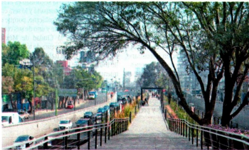
El parque cuenta con acceso para sillas de ruedas, pueden entrar mascotas y se puede recargar el celular junto a las bancas / DANIEL HIDALGO