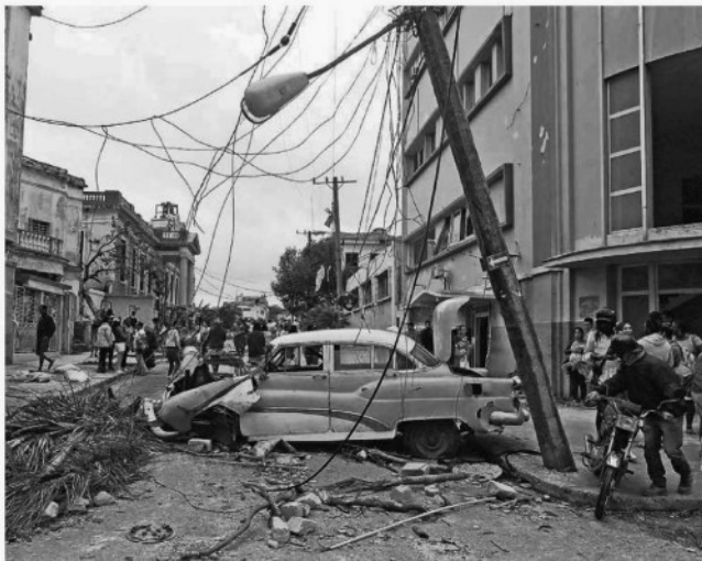
Ayer se apreciaron las afectaciones, las cuales son cuantiosas.

EL TORNADO QUE AZOTÓ LA ISLA EL 27 DE ENERO DEJÓ DAÑOS EN LOS MUNICIPIOS DE REGLA, GUANABACO, DIEZ DE OCTUBRE Y SAN MIGUEL. PÁG. 21