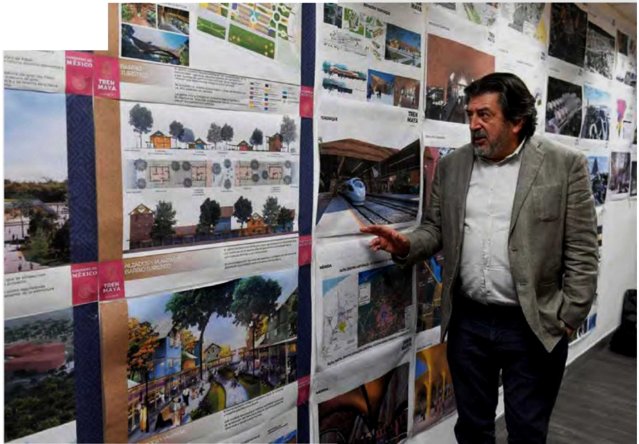
● AVANCE. El titular de Fonatur muestra a El Herald de México elpre Plan Maestro del plan ferroviario que correrá en el sur del país.